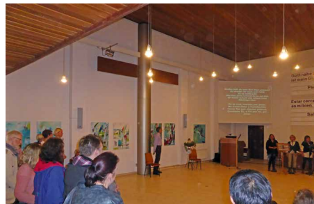
Vernissage zur Kunstausstellung