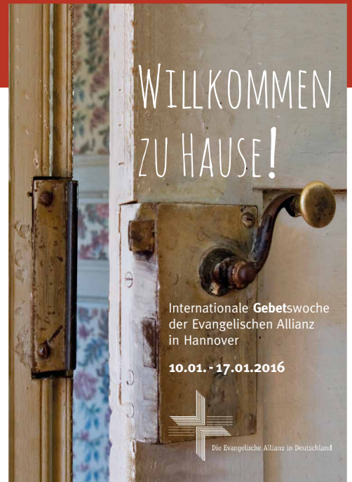
Gestaltung: gaenshirt-grafic.de

Jugendverband der Evangelischen Freikirchen Christengemeinde Elim, Hermann-Gebauer-Weg 3.