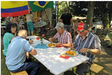
kulinarisches Fest der Kulturen